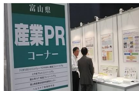
产业 PR 区