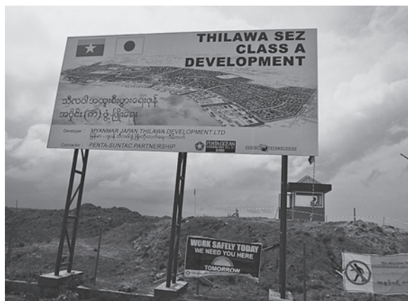
工業団地現場(1) 2014年6月16日撮影