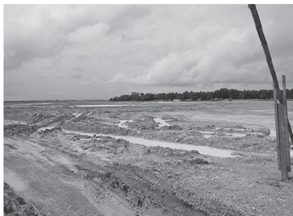
工業団地現場(2) 2014年6月16日撮影