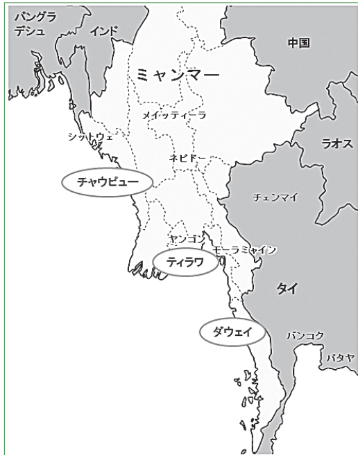
図1 ミャンマー経済特区