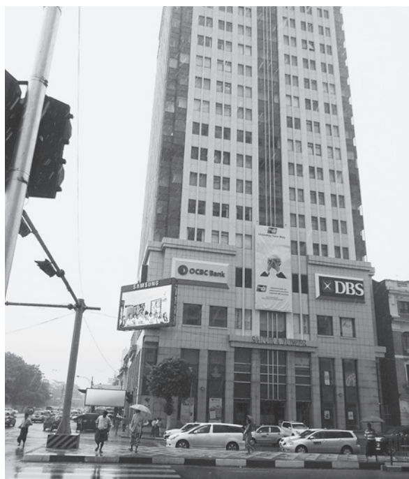
日系企業が多く入る「サクラタワー」

会社登記簿のコピーが必要となる。空港の入国審査の前の段階でビザを$50で買い、入国審査に向かう。ただしこの場合、非常に可能性は低いがビザが不許可になるリスクがあり、その場合本国送還になるため、日本での事前取得が望ましい。