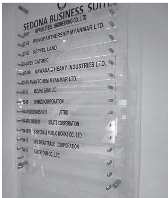
日系企業名が並ぶ「セドナホテル」のボード