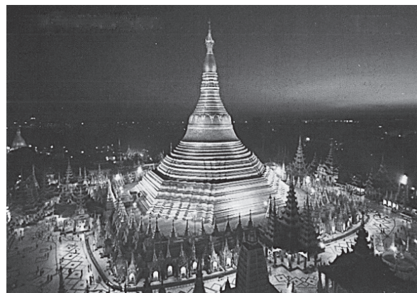
シュエダゴン PAGODA（ミャンマー）

上記の方々からの聴取内容は重複する部分があるため、各人毎ではなく項目毎に述べる。