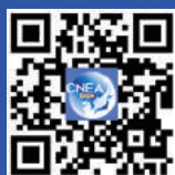
中国—东北亚博览会 官方网站