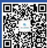
中国—东北亚博览会 官方微信