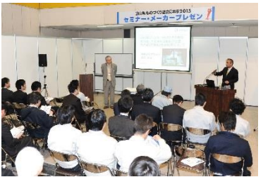
セミナー・メーカープレゼン