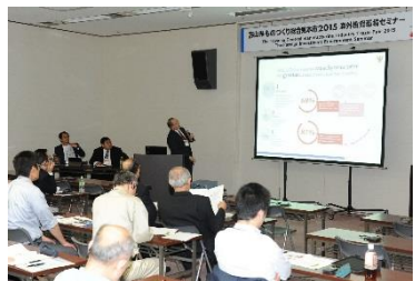
海外投資環境セミナー