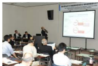
海外投資環境研討會