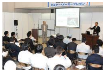
研討會・廠商發表會