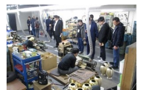
기업 시찰회 모습(2019년)