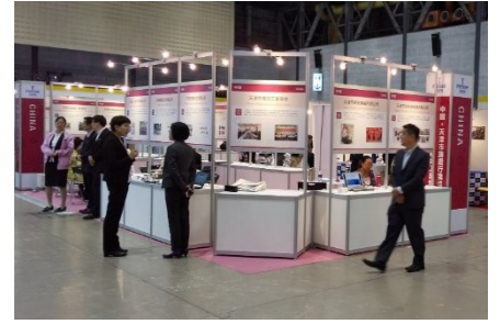
연대 전시 부스

또한 기업이나 개인이 단독으로 부스 참가를 희망하는 경우, 표준 타입 부스(W2,970mm x D1,980mm) 1 부스당 65,000 엔(국내 참가자의 반액에 해당함. 소비세 10%포함)으로 참가가 가능합니다.※자세한 사항은 뒷면 참가 규정을 참조.