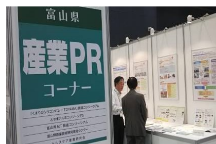
産業 PR 區