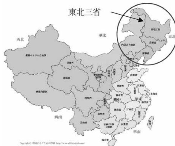
東北三省：遼寧省、吉林省、黒龍江省の三省 （地図は「中国まるごと百貨辞典」より参照）

以下の2～3項では、東北経済振興のために中国政府が実施している施策について記載したい。