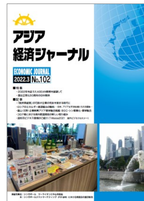
アジア経済ジャーナル