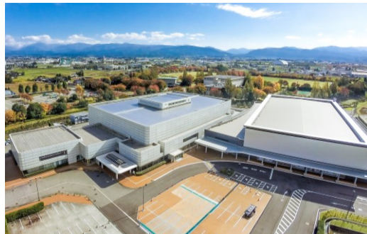
見本市会場 (富山産業展示館)