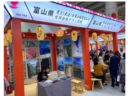
海外展示会への出展支援

※とやま中小企業チャレンジファンド事業では販路開拓以外にも、幅広い取り組みを支援しています。詳しくは富山県新世紀産業機構のホームページ( https://www.tonio.or.jp/ )をご覧ください。