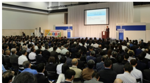
見本市会期中の様子