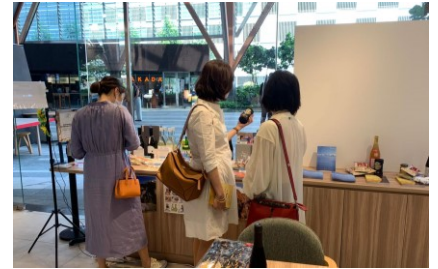
テストマーケティングの様子