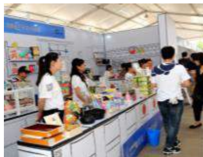
商品展示販売エリア