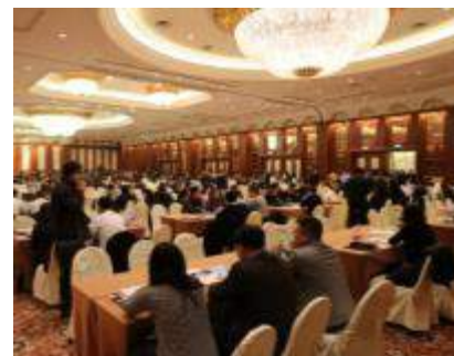
日本商品受注エリア