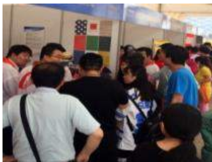
日本特色飲食エリア